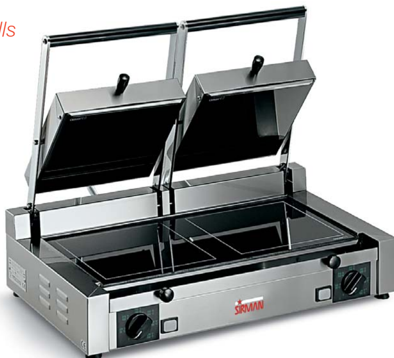
PD VT LL-LL