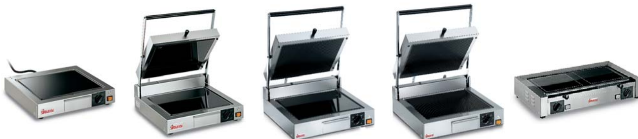
TOP CORT VT