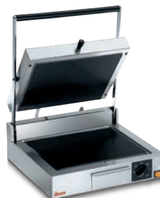
CORT VT RR