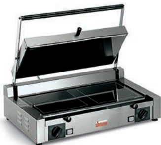
PD VU LL-LL