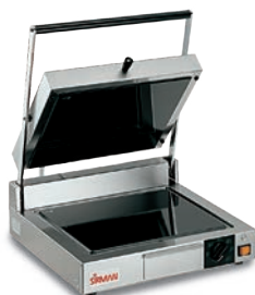
CORT VT LL