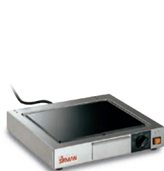
TOP CORT VT