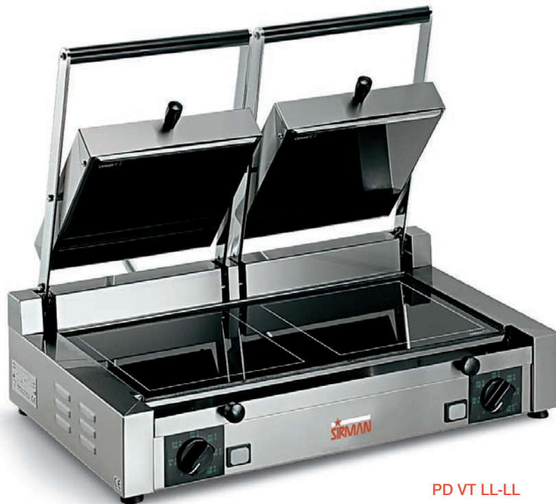
PD VT LL-LL