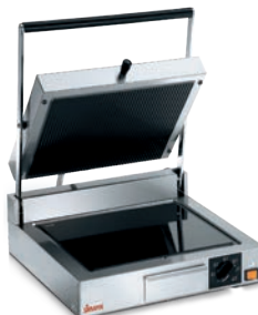
CORT VT LR