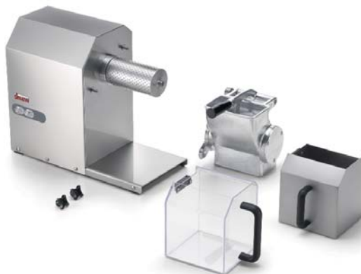
GFX HP 1.5-2