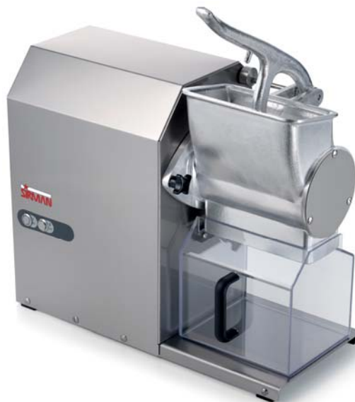
GFX HP 2

IP 54 protection rate 24V controls. Motor break. Safety microswitches on lever and receiving tray.