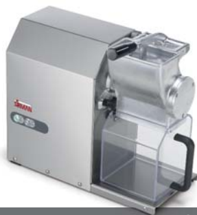
GFX HP 1,5