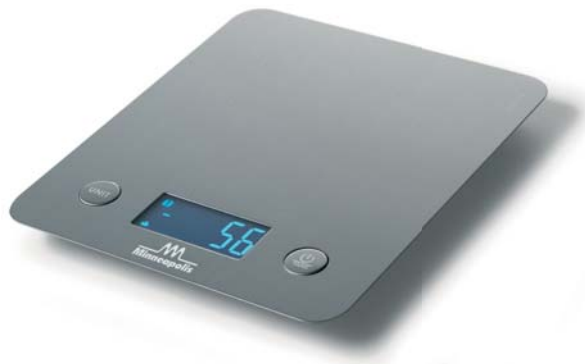
MINNEAPOLIS 5/1 FLAT INOX