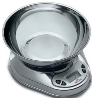
MINNEAPOLIS 5/1 INOX