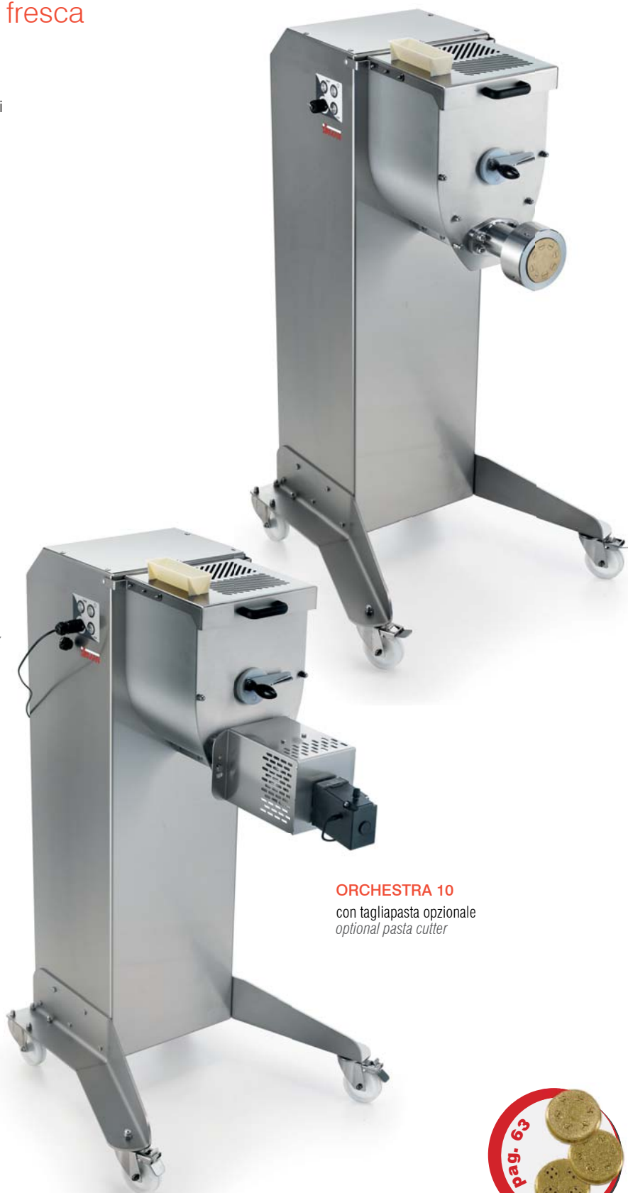
ORCHESTRA 10 con tagliapasta opzionale optional pasta cutter