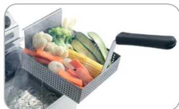
Cestello per cottura a vapore opzionale Optional steam cooking basket