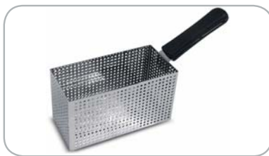
Cestello maxi: di serie per PASTÌ 10 / opzionale per PASTÌ 8 Maxi basket: standard for PASTÌ 10 / optional for PASTÌ 8