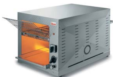
ROLLER LONG VV