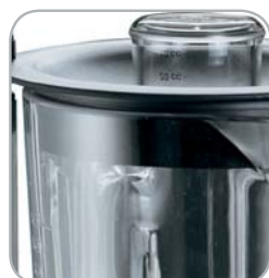
Micro su coperchio Microswitch on cover