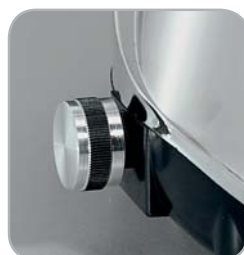
Modello VV: variatore di velocità Speed control optional