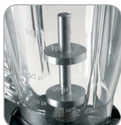
Modello caffè Coffee model