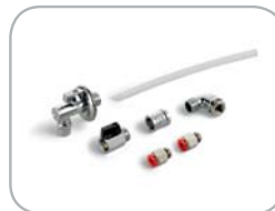
Kit collegamento scarico acqua opzionale Optional water discharge device connection kit.