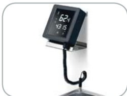
Spinotto ermetico IP 67 IP 67 hermetic connector