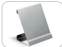
Pratica staffa di posizionamento per la scatola display The practical positioning bracket for the display box