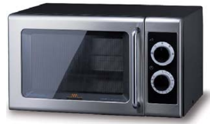
CM 1039 A