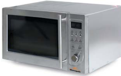
WDB 900 COMBI