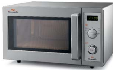
WP 1000 PF M