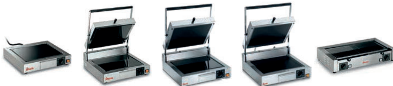
TOP CORT VT