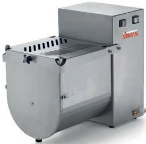
IP 20 M