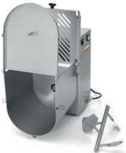
Pala facilmente rimovibile Removable mixing arm