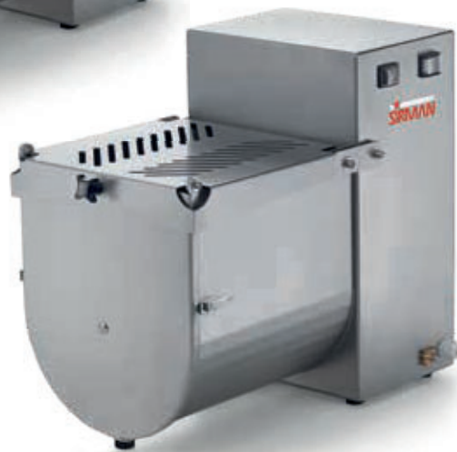
IP 10 M