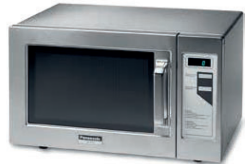
NE 1037 SELF